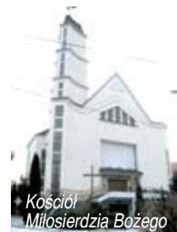
Kościół Miłosierdzia Bożego