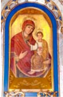
Ikona z cerkwi