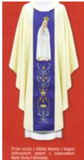
Ornat wstęży z lekką tkaniną z bogato haftowanymi pasami z wizerunkami Matki Bożej Fatimskiej.