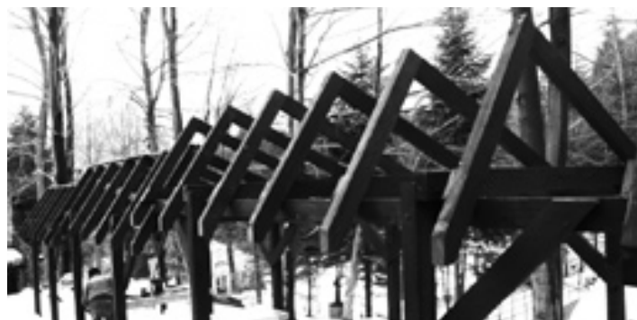
W Heluszu koontynuowana jest praca przy odnowieniu daszków ze stolami przy amfiteatrze i starej scenie.

5. Droga Krzyżowa dla dzieci będzie w czwartek o godz. 17:00, natomiast dla dorosłych w piątki dwukrotnie: o godz. 17.00 w kościele i o godz. 19.00 w terenie. W najbliższy piątek (8 III) Droga Krzyżowa rozpocznie się o godz. 19.00 przed sklepem Korona, którą poprowadzą: Koło Misyjne, Róże, Bractwa. Bardzo zachęcamy do pielęgnowania tej wyjątkowo cennej tradycji udziału w drodze krzyżowej osiedlowej.