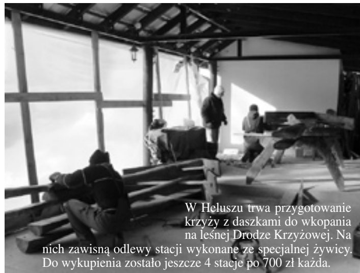
W Heluszu trwa przygotowanie krzyży z daszkami do wkopania na leśnej Drodze Krzyżowej. Na nich zawisną odlewy stacji wykonane ze specjalnej żywicy. Do wykupienia zostało jeszcze 4 stacje po 700 zł każda.

12. Bezinteresowna pomoc przy wypełnianiu PIT-ów do Urzędu Skarbowego odbywa się w Sali komputerowej i lustrzanej codziennie w godz. 16.00-17.30. Zapraszamy.