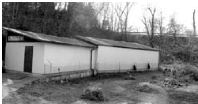
To co było zbędne zostało wycięte i pocięte. Pozostało uzupełnienie słupki i siatki, oraz usunąć śmieci.