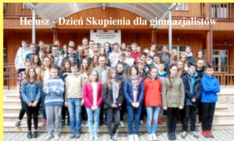
Helusz - Dzień Skupienia dla gimnazjalistów