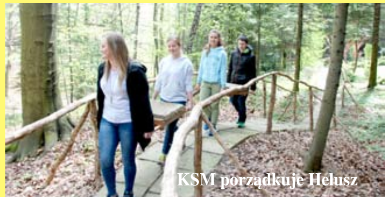
KSM porządkuje Helusz