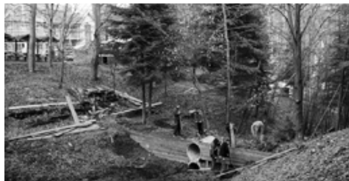
Będzie mostek przez wąwóz czyli przejście pomiędzy XII i XIII stacją.