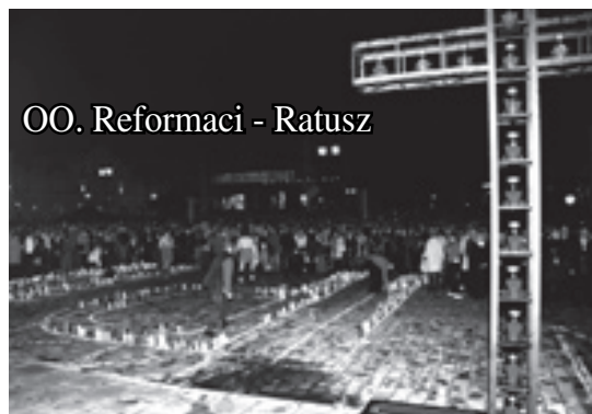
OO. Reformaci - Ratusz