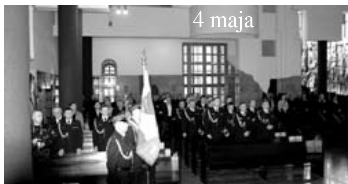
Msza św. w intencji strażaków PSP, emerytów, oraz kolegów, którzy odeszli już do Pana.