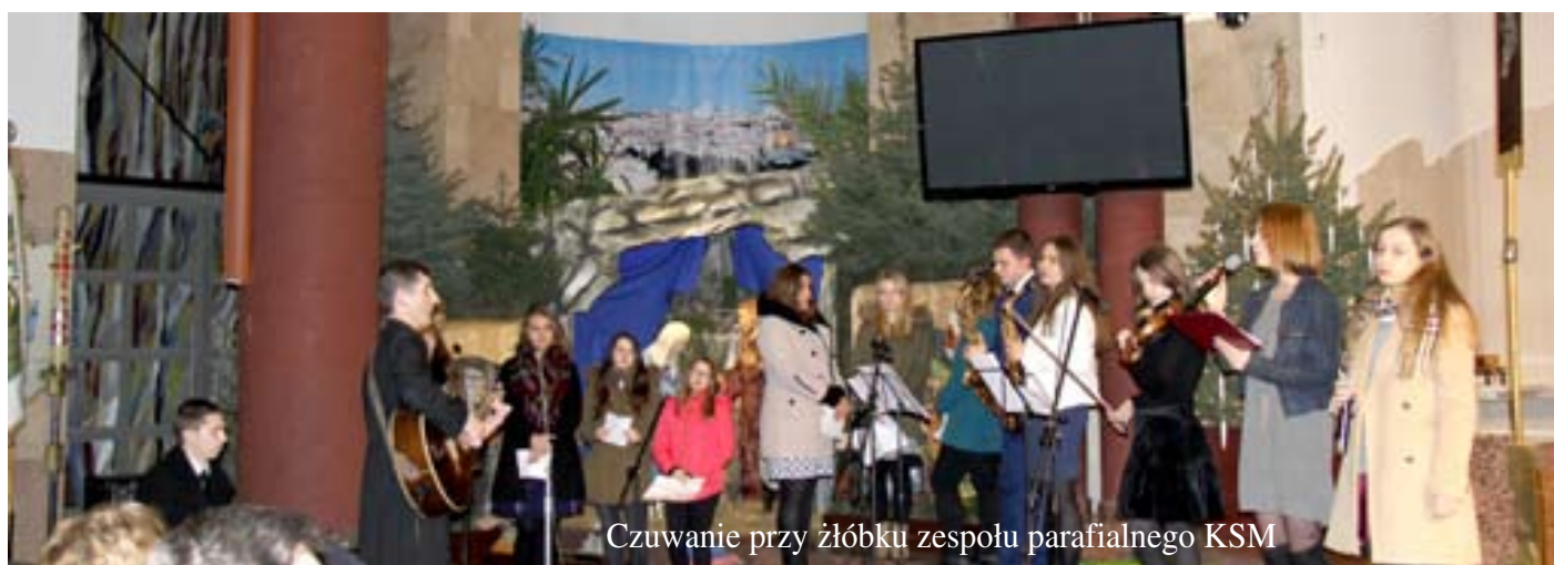
Czuwanie przy żłóbku zespołu parafialnego KSM