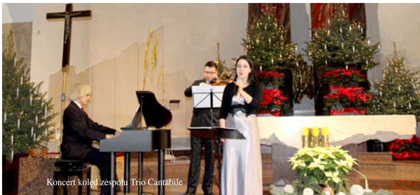
Koncert kolęd zespołu Trio Cantabile