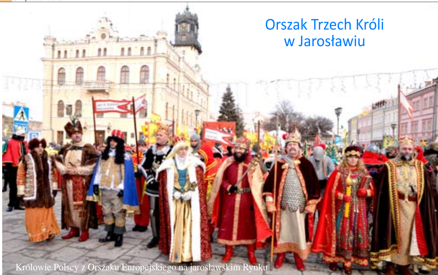
Królowie Polscy z Orszaku Europejskiego na jarosławskim Rynku