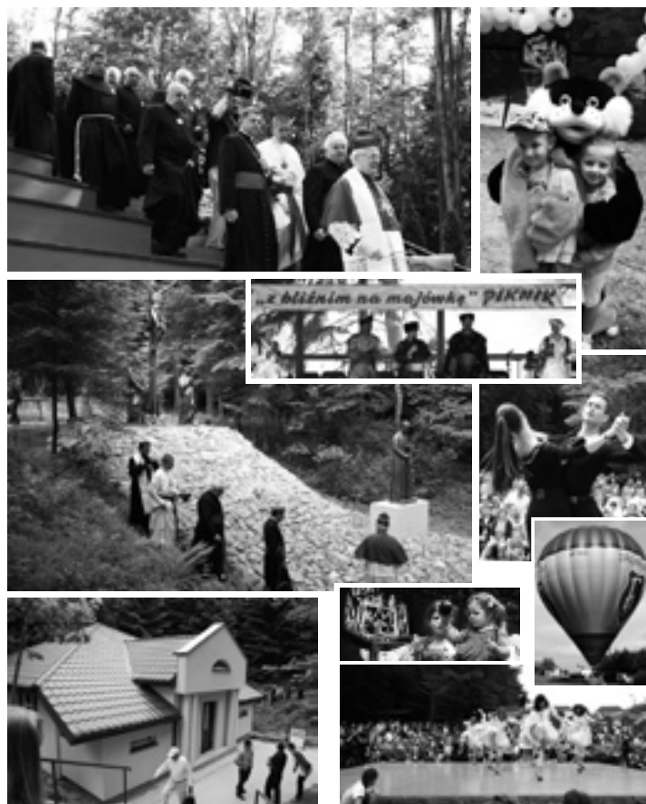
Nowa sala konferencyjna