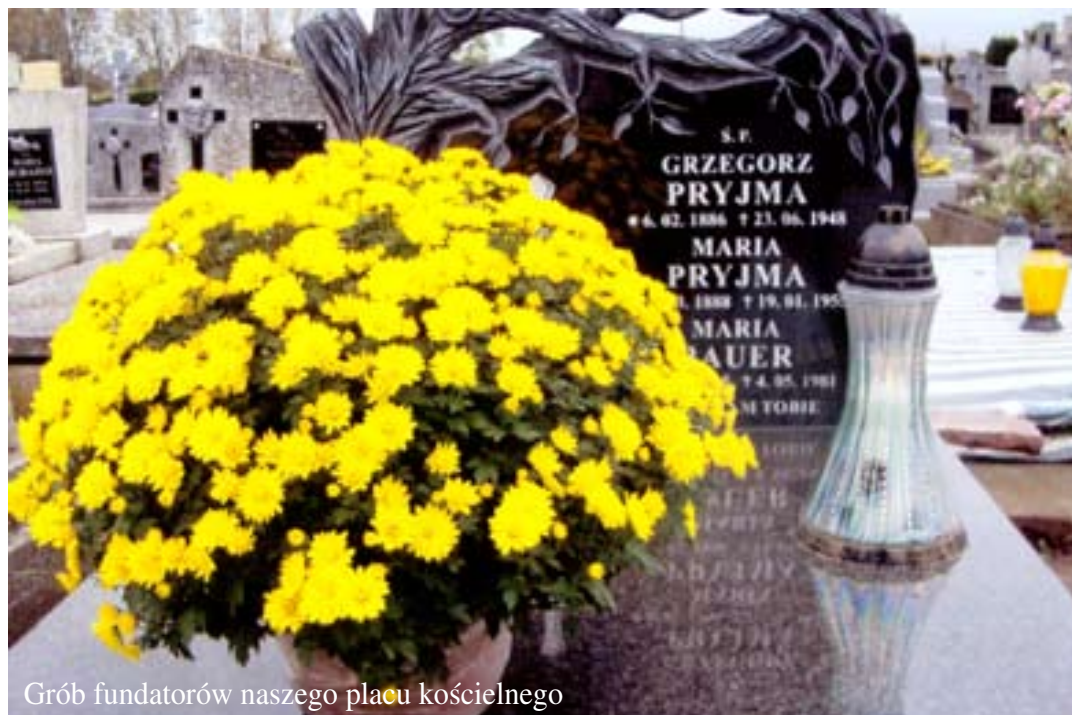
Grób fundatorów naszego placu kościelnego