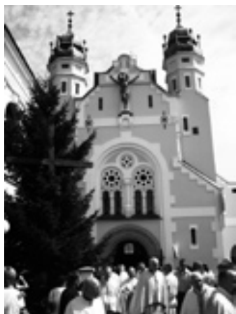
Cerkiew grekokatolicka Przemienienia Pańskiego w Jarosławiu

wiu została zbudowana w latach 1717 - 1747, a przebudowana w latach 1911 - 1912.