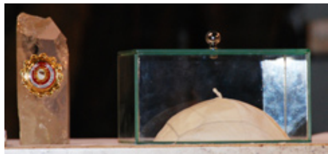
Relikwiami umieszczonymi w Kaplicy Miłosierdzia Bożego są: fragment sutanny z krwią bł. Jana Pawła II (dar kard. Stanisława Dziwisza) oraz papieska piuska.