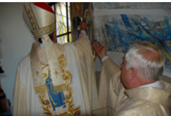
Relikwiarz autorstwa artysty rzeźbiarza Macieja Zychowicza jest odlewem w brązie pokrytym grubą warstwą srebra z elementami wykonanymi ze stali nierdzewnej (jako lustro), poliwęglanu, z którego wykonana jest rura podtrzymująca piuskę oraz półokrągłe drzwiczki, a w środku umieszczony jest kryształ z relikwią pierwszego stopnia czyli krwią bł. Jana Pawła II. Kamienny napis oraz szlifowany kryształ wykonał Tadeusz Jurkowski. Odlew rzeźby wykonał Piotr Piszczkiewicz. Całość zmontowała Artystyczna Pracownia Ślusarska Słowik.