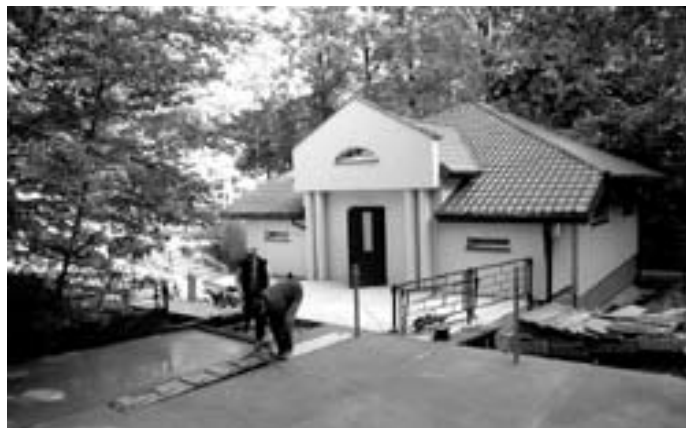
W Heluszu przed salą konferencyjną powstał duży plac rekreacyjny, na którym staną specjalne ławeczki.

Zachęcamy więc każdego z wiernych do głosowania w zgodzie z własnym sumieniem, wrażliwym na dobro wspólne i stojącym na straży życia każdego człowieka od poczęcia do naturalnej śmierci i na straży normalnej rodziny.