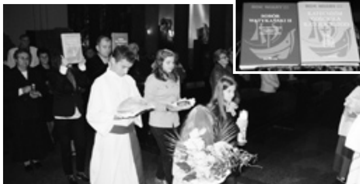
Uroczyste wniesione egzemplarze Ksiąg Soborowych i Katechizmu Kościoła Katolickiego będą eksponowane na kamiennym postumencie przez cały najbliższy rok.