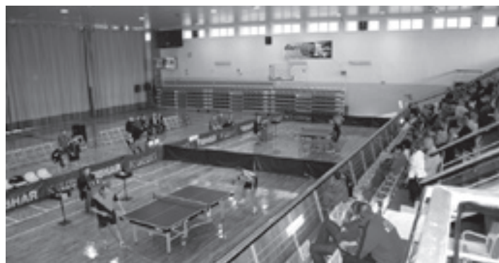
Gościwna hala MOSiR.