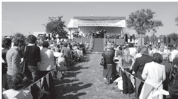
Wartość modlitwy Różańcowej jest bezcenna - bądźmy dobrymi świadkami.

Przypominamy, że za odmówienie różańca (5 tajemnic) zyskuje się odpust zupełny pod zwykłymi warunkami, ilekroć różaniec odmawia się w kościele, w kaplicy lub w rodzinie.