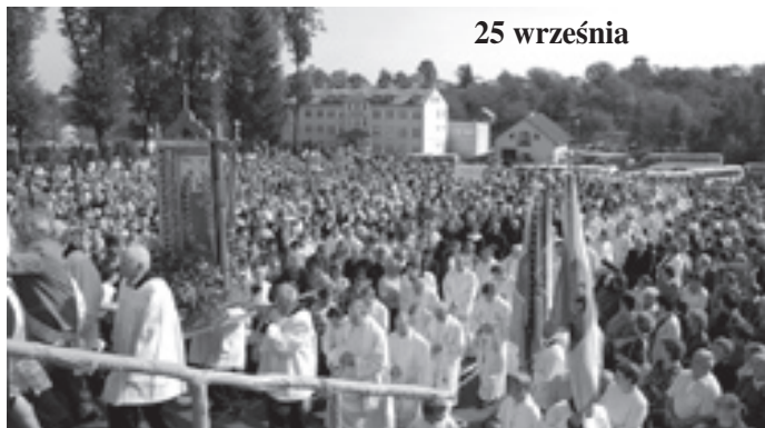
Było kilka tysięcy wiernych i kilkudziesięciu księży.