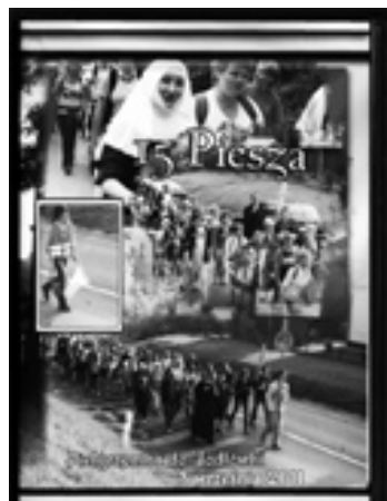
Filmy z Instalacji Relikwii oraz z Pieszej Pielgrzymki do Jodłówki. Cena każdego - 20 zł.