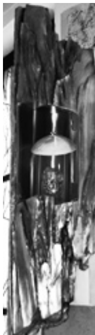
Relikwiarz bł. JP II (kropla krwi i piuska) znajduje się w Kaplicy Miłosierdzia Bożego przy naszym kościele

śmy jego nauką, zakorzenioną w Bożym słowie, potrafili żyć każdego dnia. Trwamy w tygodniu, w którym Kościół wzywa nas do szczególnej modlitwy w intencji misji. Błogosławiony Jan Paweł II, pielgrzym i misjonarz świata, przez swoje pokorne życie, podróże apostolskie i nauczanie nieustannie głosił miłość Chrystusa - jedynego Odkupiciela człowieka. Niech wstawienictwo naszego błogosławionego rodaka umacnia nas w dawaniu świadectwa wiary, byśmy nieśli światło Chrystusowego orędzia wszędzie tam, gdzie żyjemy.