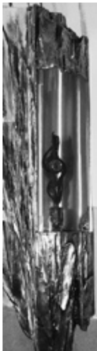
Relikwiarz bł. Jana Balickiego znajduje się w Kaplicy Miłosierdzia Bożego przy naszym kościele

Urodził się 25 stycznia 1869 r. w Staromieściu pod Rzeszowem. W 1892 r. ukończył seminarium duchowne w Przemyślu i otrzymał święcenia kapłańskie. Doktorat z teologii zrobił w Rzymie. Po powrocie wykładał w rodzimym seminarium, a w latach 1928-1934 piastował urząd rektora. Założył dom opieki dla zdemoralizowanych kobiet, który zlikwidowano po wkroczeniu do Przemyśla Sowieców w czasie drugiej wojny światowej. Nigdy nie odmawiał pomocy chorym i ubogim, ale szczególnie mocno jego służba kapłańska przejawiała się w posłudze w konfesjonale. Zmarł 15 marca 1948 r. Po siedmiu latach, zgodnie z powszechnym życzeniem, jego ciało przeniesiono do osobnego grobowca. Beatyfikacji dokonał w sierpniu 2002 r. Jan Paweł II podczas Mszy św. na krakowskich Błoniach.