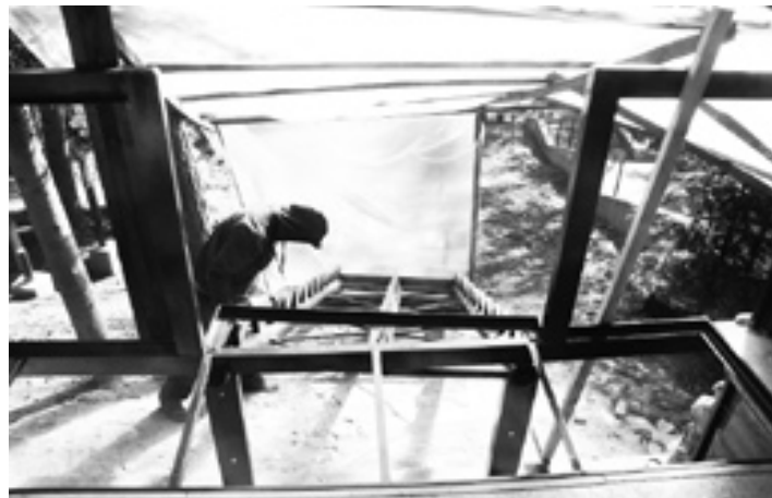
W Heluszu za sceną powstaje mały taras widokowy, który w czasie imprez osłonięty plandeką będzie pełnił funkcję szatni dla artystów.