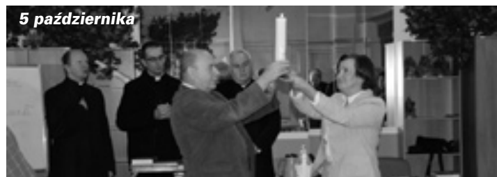
5 października Nowa para rejonowa, nowy duch, nowe wytyczne odpowiedzialnych w Diecezji.