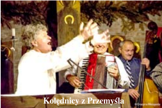
Kolędniczy z Przemyśla