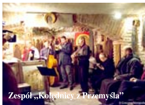
Zespół „Kolędniczy z Przemyśla”