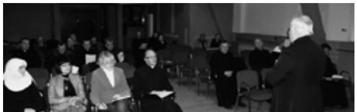
Pierwsze spotkanie organizacyjne dla szkół i księży odbyło się 29 XI w KCK.