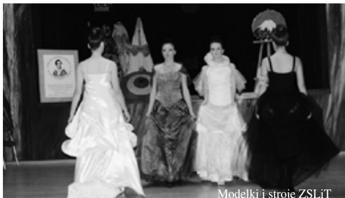
Modelki i stroje ZSLiT