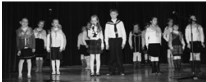
A później szczęśliwe dzieci z różnych wspólnot chwaliły się swoimi talentami.