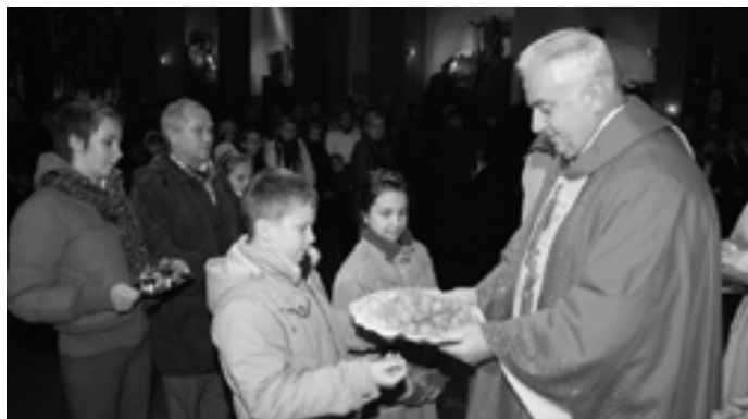
Najpierw uroczysta koncelebra z piękną oprawą liturgiczną.