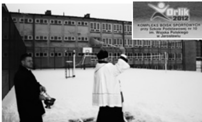
W czwartek 2 grudnia koło SP nr 10 zostały otwarte i poświęcone dwa boiska z pełnym zapleczem w ramach programu ORLIK. Otwiera to zupełnie nowe duże możliwości powszechnego uprawiania sportu.