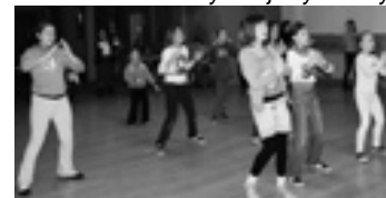
Uczymy się tańczyć