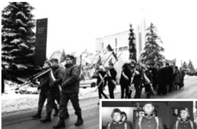
Zdjęcia z Mszy św., marszu ulicami miasta i z poświęcenia tablicy na ścianie kaplicy Starego Cmentarza.

Pamiętajmy, że liczna grupa bojowników o wolną Ojczyznę z roku 1863 pochowana została także na jarosławskim Nowym Cmentarzu, bo po zakończeniu działań zbrojnych ziemia jarosławska zapełniła się dużą liczbą zbiegłych powstańców. Wielu z nich znalazło tutaj schronienie oraz zajęcie umożliwiające im przetrwanie tych bardzo trudnych czasów. (frag. opracowania Zbigniewa Zięby)